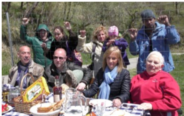
Diversos ribetans han participado en el corto “En la mesa cabemos todos”

Dinàmic Enginy, entidad coorganizadora del Festival Gollut ha producido un corto de ficción, en colaboración con la compañía Teatre d’Emergència que se proyectará al principio de todas las sesiones del Festival Gollut que tiene como temática principal la actitud de nuestra sociedad respecto a lo que pasa en el mundo y está inspirado en la situación que viven muchas personas como refugiadas en el momento de llegar a países occidentales. El film será difundido antes de empezar el festival.