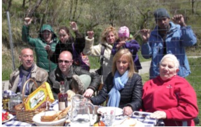
Diversos ribetans han participat en el curtmetratge “A taula hi cabem tots”

Dinàmic Enginy, entitat coorganitzadora del Festival Gollut ha produït un curtmetratge de ficció, amb la col·laboració de Teatre d’Emergència que es projectarà al començament de totes les sessions del Festival Gollut que té com a temàtica principal l’actitud de la nostra societat respecte als que passa al món i està inspirat amb la situació que viuen moltes persones com a refugiades a l’arribar a països occidentals. El film serà difós abans de començar el festival.